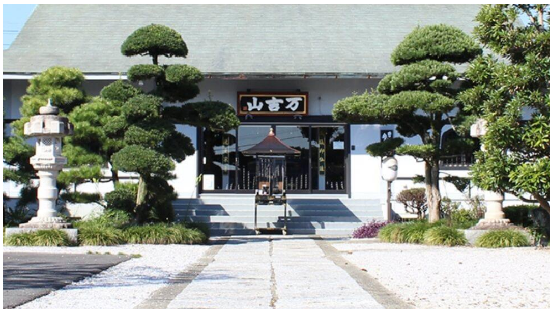
〔見性院 けんしょういん〕

生前葬は生前に行なう葬儀のことです。当院では仏教(信)徒になっていただき当院の会員証と戒名、生前葬証明書を授与されます。戒名不要の方でも生前葬を行うことができます。